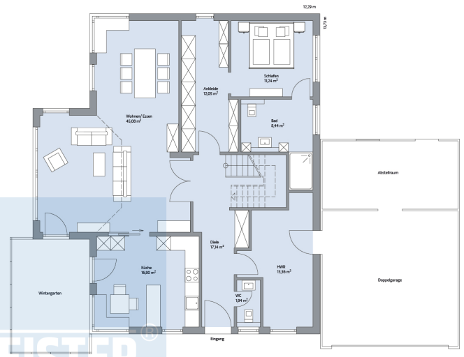
Haus Wellenberg Grundriss