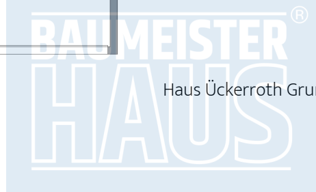
Haus Ückerroth Grundriss