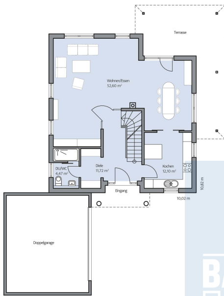
Haus Quirin Grundriss