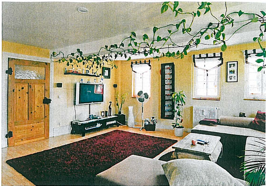
Historische Stütze im Erdgeschoss: Sie stammt vom 1723 erbauten Glockenturm des Zuzenhauser Rathauses.

troffenen Wandpartien waren mit Massivmauerwerk ausgebessert. Die Firma Reinhardt riss es wieder ein und rekonstruierte das Ganze mit Eichenbalken von 1832.