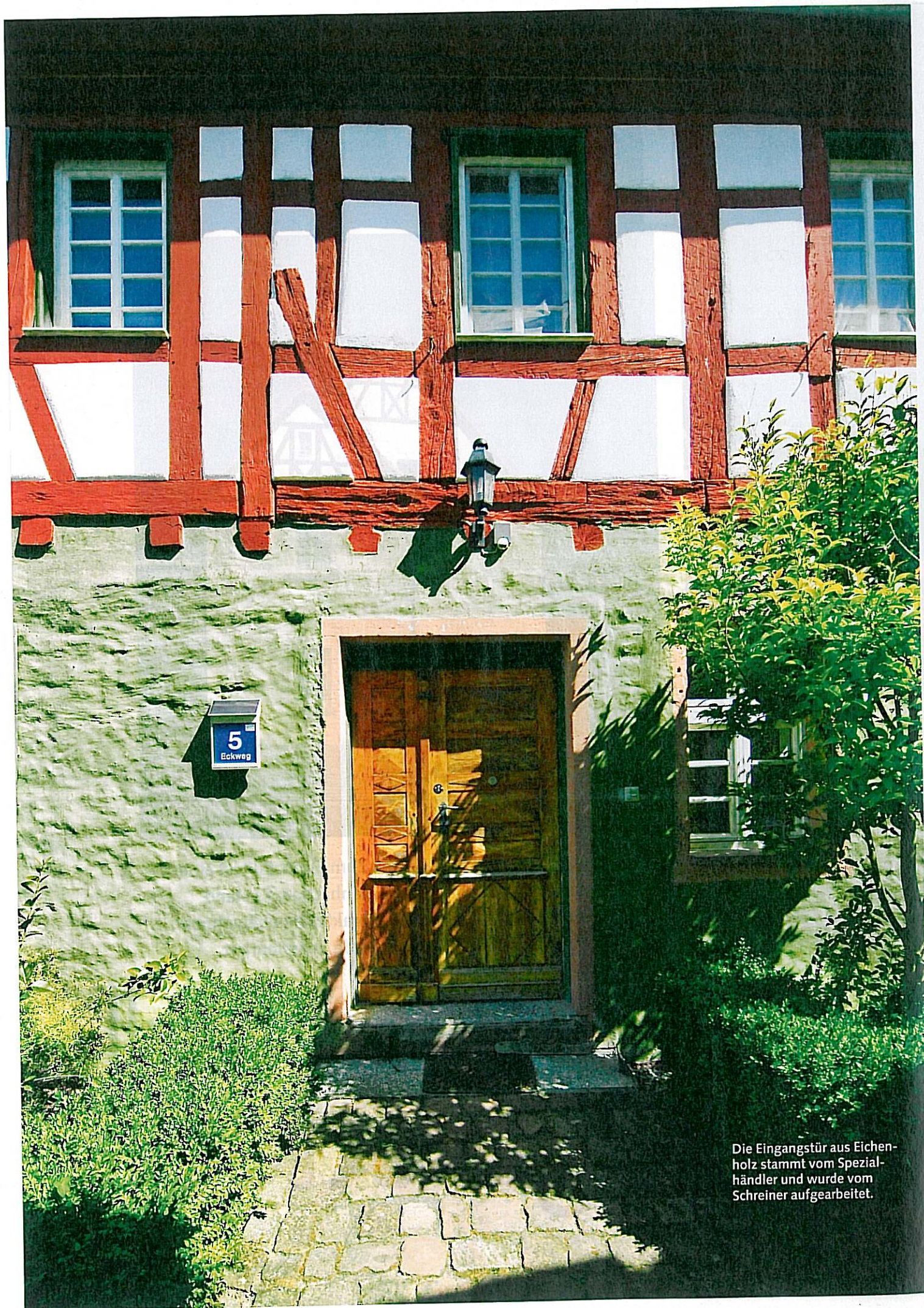
Die Eingangstür aus Eichenholz stammt vom Spezialhändler und wurde vom Schreiner aufgearbeitet.